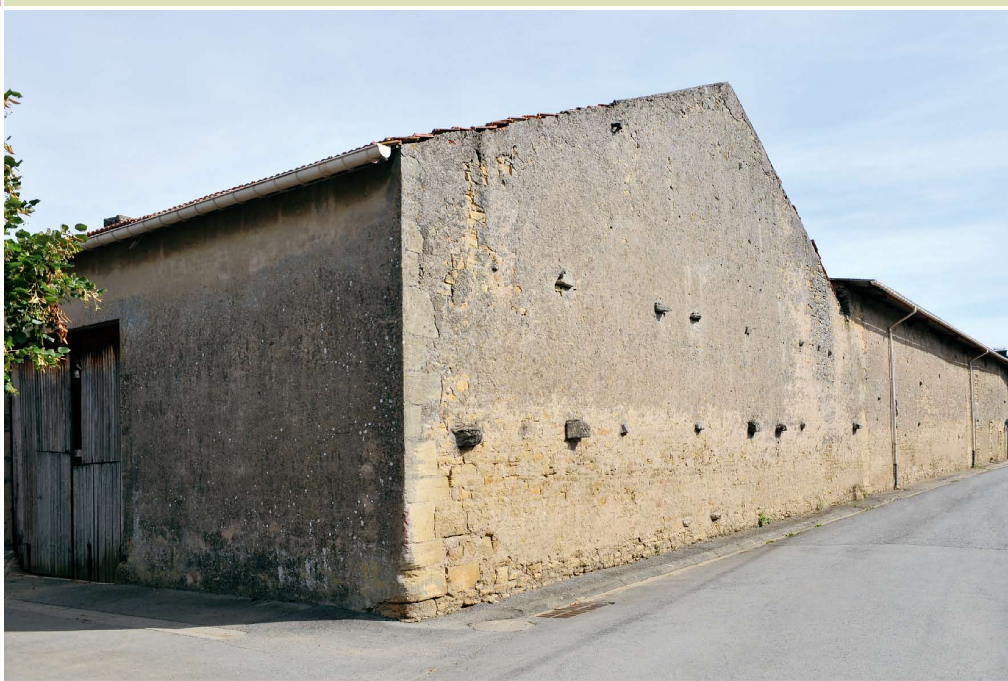
La ferme carrée

Il se compose en majeure partie de fermes à deux travées d'exploitation, logis et grange ou logis et étable, transformées ou non en maison.