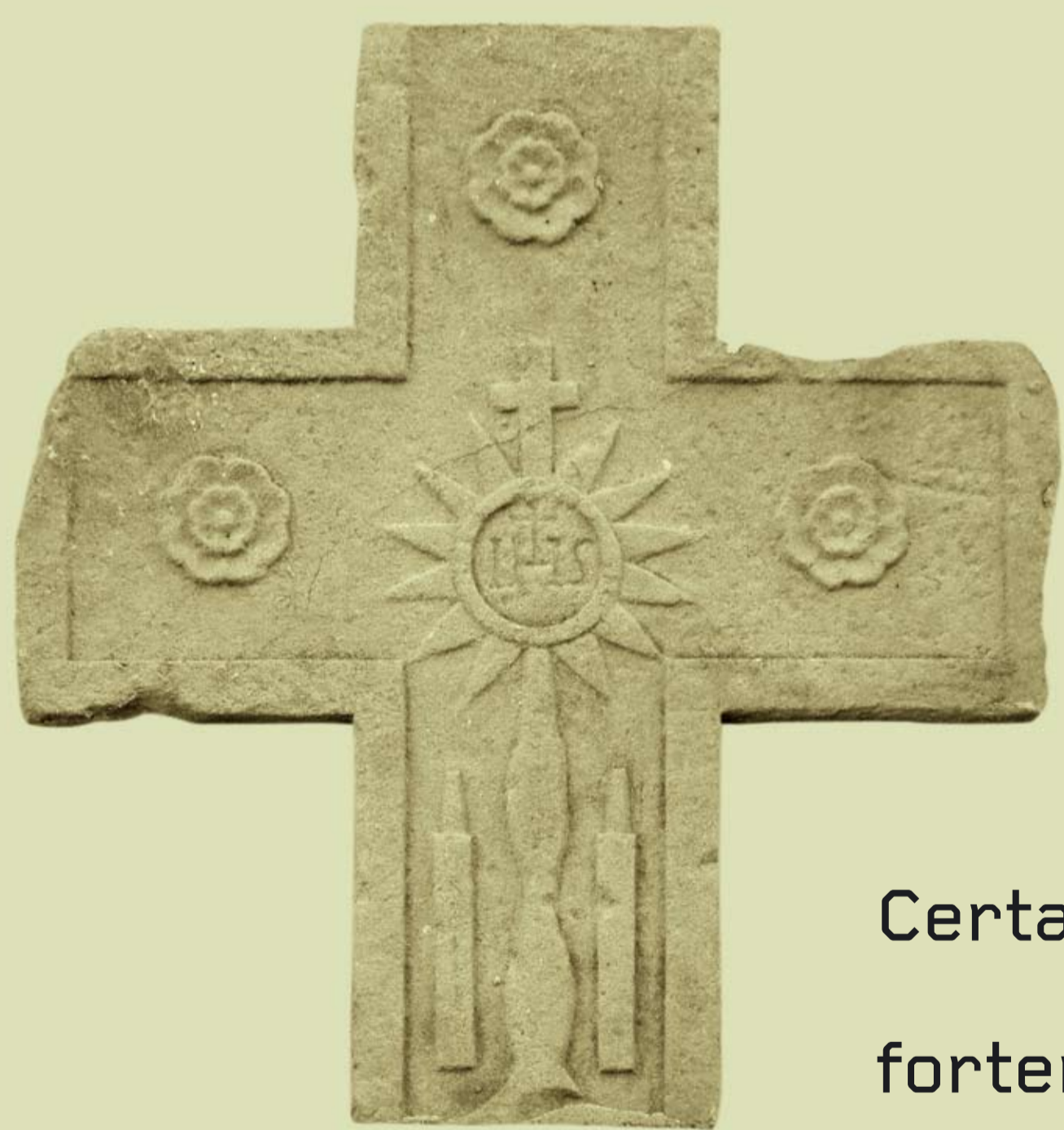
Élément ancien réutilisé comme décor d'architecture

La « ferme carrée » est la plus ancienne. Construite au XVI e siècle, d'après une date (en partie illisible) retrouvée dans la cour, elle est toujours exploitée. Différents corps de bâtiment sont organisés sur les deux côtés d'une cour clôturée. Une partie des murs d'origine a été détruite pour construire un hangar moderne. Le logis est percé de baies à linteaux délardés en arc segmentaire datant du XVIII e siècle. À l'intérieur, est conservée une cheminée avec four à pain.