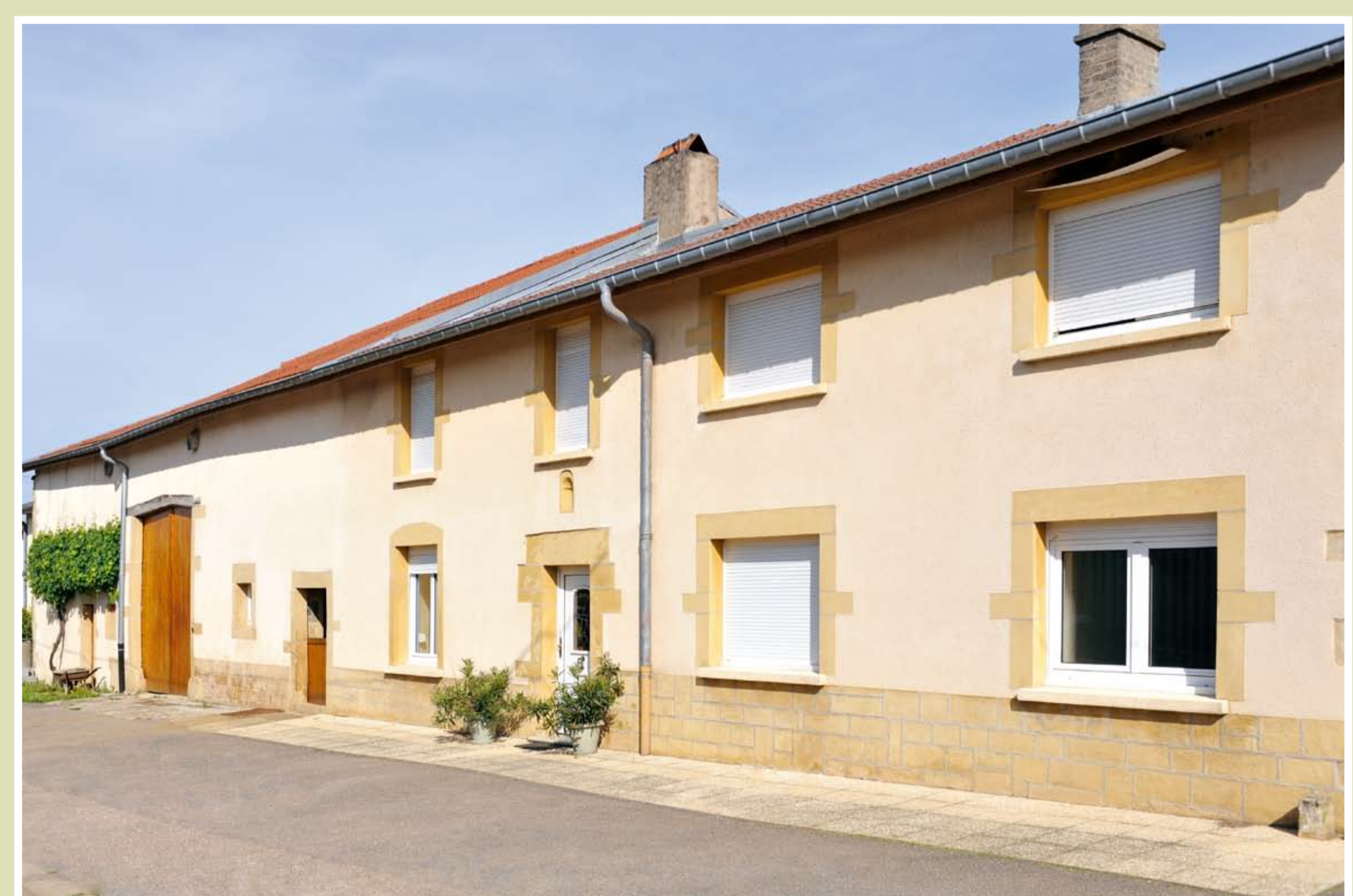
Rue Joffre, ferme à trois travées

Le bâti récent (XX e siècle) est principalement situé rues Jules Ferry et côté droit de la rue Joffre en partant de l'église.